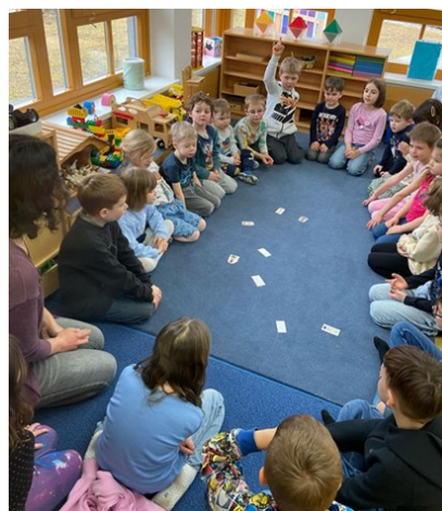
Vorlesen im Kindergarten